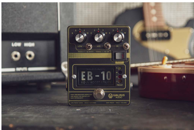
EB-10 BLACK (item 53711)