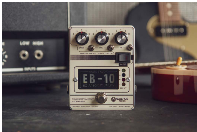
EB-10 CREAM (item 53712)