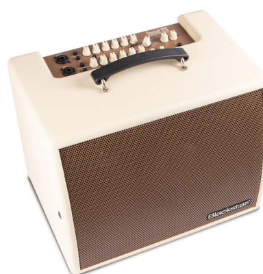
SONNET 120 Blonde