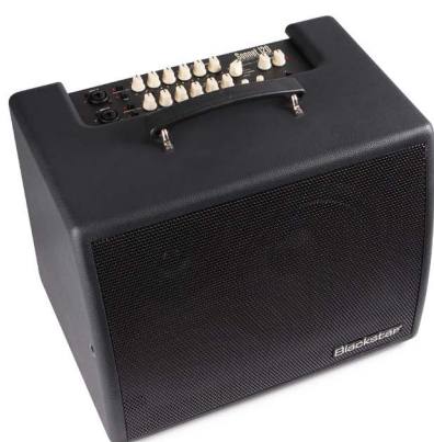
SONNET 120 Black